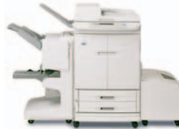
HP Color LaserJet 9500mfp met multifunctionele finisher

C8084A – uitvoereenheid Uitvoer voor 3000 vel papier met job offset.