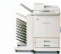
HP Color LaserJet 9500mfp met optioneel 8-baks sorteersysteem