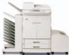
HP Color LaserJet 9500mfp met 8-baks sorteersysteem

Netsnoer, telefoonsnoer (in landen met faxondersteuning), printerdocumentatie, cd-rom met printersoftware, overlay voor bedieningspaneel, printcartridges (4), twee invoerladen voor 500 vel, multi-purpose lade voor 100 vel, high-capacity invoerlade voor 2000 vel (Q1891A), automatische duplexmodule, automatische documentinvoer, HP Jetdirect 620n Fast Ethernet printserver, 20-Gb EIO vaste schijf – vereist uitvoerapparaat naar keuze moet apart worden besteld.