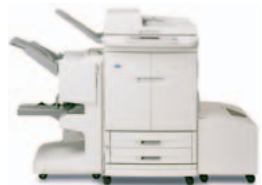
HP Color LaserJet 9500mfp, met multifunctionele finisher en optionele high-capacity invoerlade