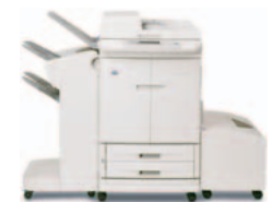
HP Color LaserJet 9500mfp, met uitvoereenheid/nietmachine en optionele high-capacity invoerlade