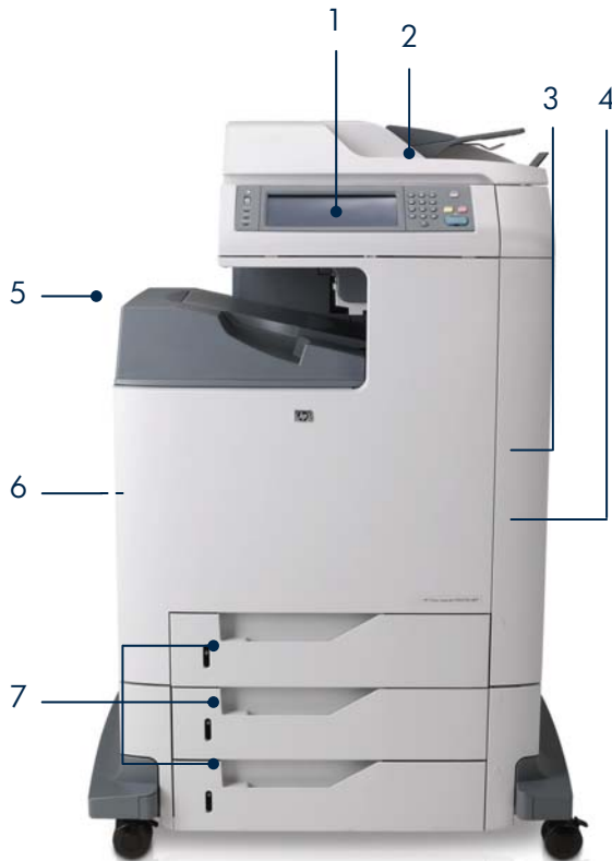
Vista frontal do HP Color LaserJet CM4730f MFP