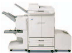
HP Color LaserJet 9500 MFP