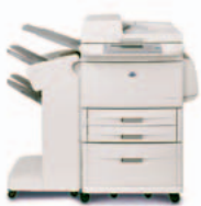
HP LaserJet 9040 MFP/ 9050 MFP