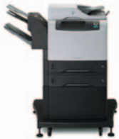
HP LaserJet 4345 MFP Serie