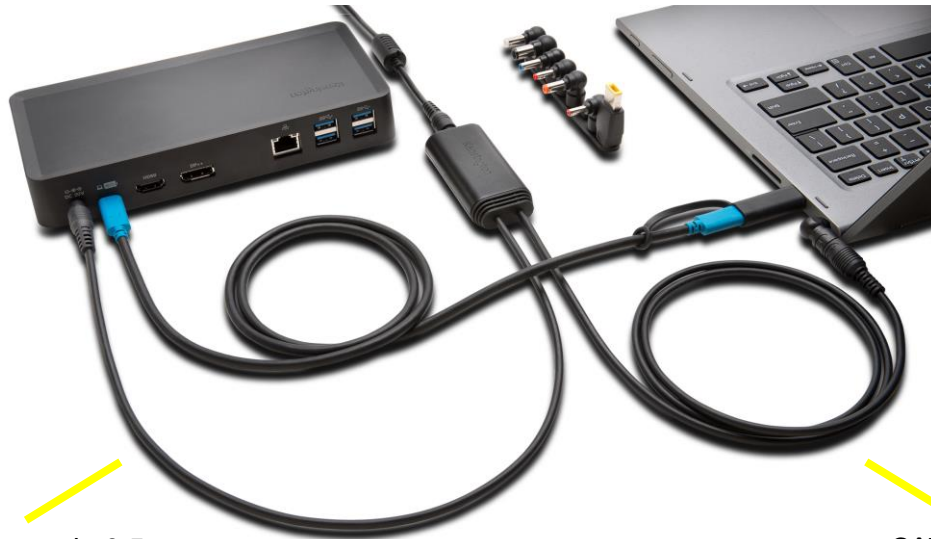
Câble secteur de 0,5 m (relie la station d'accueil SD4700P au répartiteur)