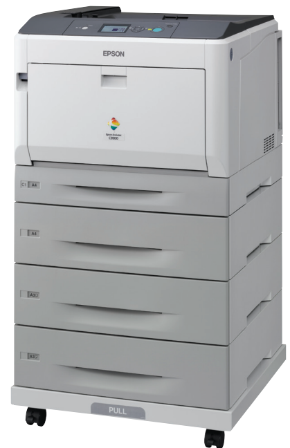
Getoonde model: AL-C9300D3TNC met mogelijkheid voor dubbelzijdig afdrucken, 3 extra papierladen en printeropzetelement