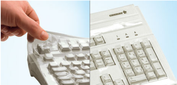
Ausführungsvarianten können von Produktabbildung abweichen

Irrtum, technische Änderungen und Liefermöglichkeiten vorbehalten. Technische Angaben beziehen sich nur auf die Spezifikation der Produkte. Eigenschaften werden damit nicht zugesichert.