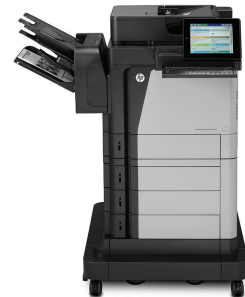
HP LaserJet Enterprise Flow MFP M630z