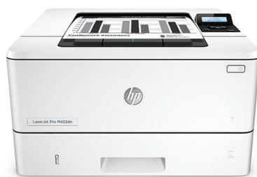
HP LaserJet Pro M402dn

Massima sicurezza, prestazioni di stampa ottimali adattabili al vostro modo di lavorare. Questa efficiente stampante completa i lavori più rapidamente e offre una protezione esaustiva dalle minacce 1 . Stampate più pagine senza dover sostituire le cartucce toner HP originali con JetIntelligence 2 .