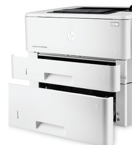
HP LaserJet PRO M402dn con vassoio da 550 fogli opzionale