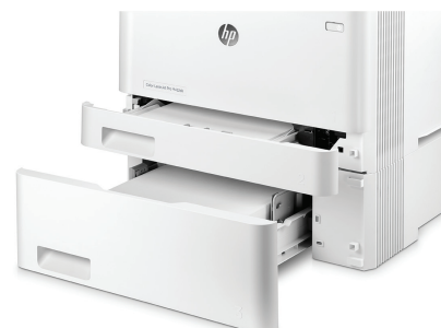
HP LaserJet Pro M452dn med fack för 550 ark som tillval