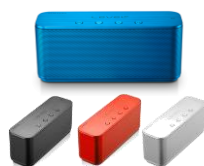
Level Box mini EO-SG900