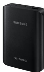
Externer Akkupack (10.200 mAh) mit Schnellladefunktion EP-PG935