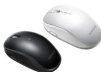
S Action Mouse ET-MP900