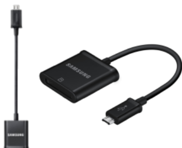
USB-Adapter/ SD-Adapter ET-R205/ ET-SD10