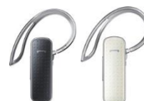
Bluetooth® Headset EO-MN910