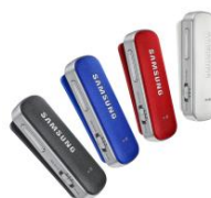
Level Link EO-RG920