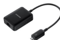
LAN/USB Hub ET-UP900