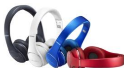
Level On Wireless EO-PN900