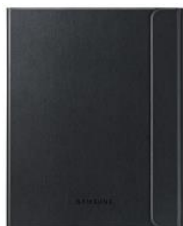
Book Cover EF-BT810