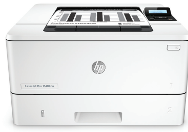
HP LaserJet Pro M402dn

Druckleistung und zuverlässige Sicherheit, angepasst an Ihre Arbeitsweise. Mit diesem leistungsfähigen Drucker können Sie Aufgaben schneller erledigen und Ihre Daten vor Bedrohungen schützen. 1 Original HP Tonerkartuschen mit JetIntelligence sorgen für eine höhere Reichweite. 2