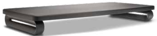
Support SmartFit® extra-large pour écrans mesurant jusqu'à 27 pouces