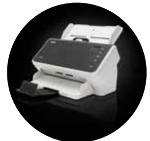
Alaris S2050/S2070 Scanner