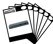
1x User manual