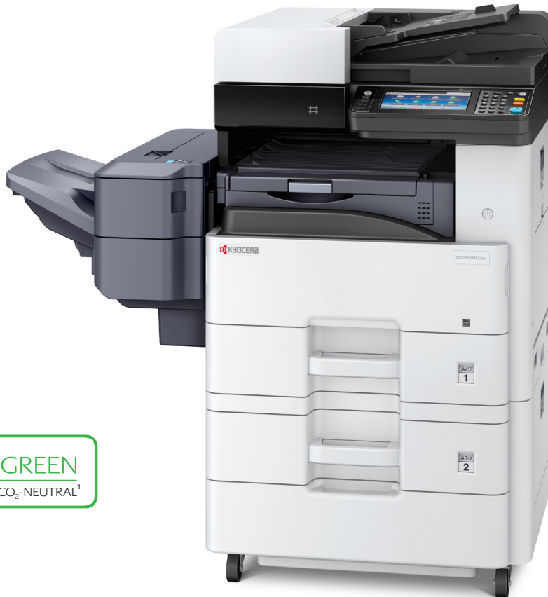
Abb. zeigt ECOSYS M4132idn mit Optionen