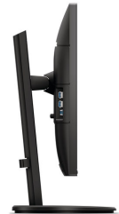
Imagen clara y rendimiento eficiente