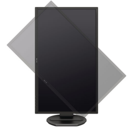
Imagen clara y rendimiento eficiente