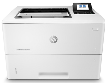
Impresora HP LaserJet Enterprise M507dn

Elige una impresora HP LaserJet Enterprise que se ha diseñado para gestionar soluciones empresariales de forma eficiente y segura. Además, ahorra energía gracias al tóner HP EcoSmart negro. Afronta las exigencias de un negocio en crecimiento con una impresora en la que puedes confiar. 1