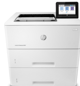
Impresora HP LaserJet Enterprise M507x

Impresora con seguridad dinámica habilitada. Para ser exclusivamente utilizada con cartuchos que utilicen un chip original de HP. Es posible que no funcionen los cartuchos que no utilicen un chip de HP, y que los que funcionan hoy no funcionen en el futuro. Obtenga más información en: http://www.hp.com/go/learnaboutsupplies