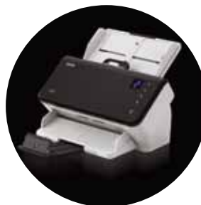
Scanner Alaris E1025 e E1035

* La velocità di elaborazione può variare in base al software applicativo, al sistema operativo e al PC in uso, oltre che alle funzioni di elaborazione immagini selezionate.