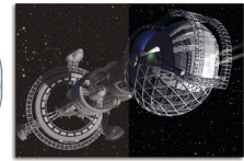
Without SmartImage™ With SmartImage™

Das neue Philips Gaming Display verfügt über eine OSD-Steuerung mit Schnellzugriff (speziell auf Spieler abgestimmt) und bietet Ihnen mehrere Optionen. Der "FPS"-Modus (First Person Shooting) verbessert dunkle Bereiche in Spielen und ermöglicht Ihnen, versteckte Objekte in solchen Bereichen zu sehen. Der "Racing"-Modus stellt das Display auf die schnellste Reaktionszeit und hohe Farbwiedergabe ein, und nimmt zusätzlich Bildanpassungen vor. Der "RTS"-Modus (Real Time Strategy) verfügt über einen speziellen SmartFrame-Modus, der das Hervorheben des bestimmten Bereichs ermöglicht und Größen- und Bildänderungen erlaubt. "Gamer 1" und "Gamer 2" ermöglicht das Speichern individueller Einstellungen für unterschiedliche Spiele, um die beste Leistung sicherzustellen.