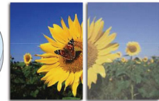
With SmartImage Without SmartImage

SmartImage è un'esclusiva tecnologia di ultima generazione di Philips che analizza i contenuti visualizzati sullo schermo e offre prestazioni di riproduzione ottimizzate. Questa interfaccia intuitiva consente di selezionare varie modalità come ufficio, immagini, intrattenimento, gioco, risparmio energetico e così via, per l'abbinamento perfetto all'applicazione utilizzata. Sulla base della scelta, SmartImage ottimizza in maniera dinamica il contrasto, la saturazione del colore e la nitidezza delle immagini e dei video per prestazioni di visualizzazione ottimali. La modalità di risparmio energetico consente di risparmiare notevolmente. Il tutto in tempo reale premendo solo un pulsante!