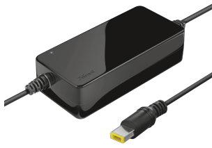
PRODUCT VISUAL 1