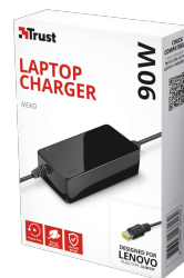
PACKAGE VISUAL 1