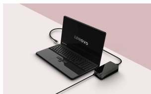
LIFESTYLE VISUAL 1