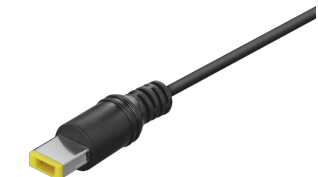
PRODUCT VISUAL 3