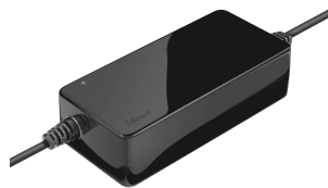
PRODUCT VISUAL 2