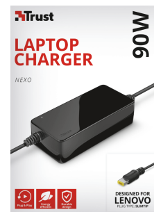
PACKAGE FRONT 1