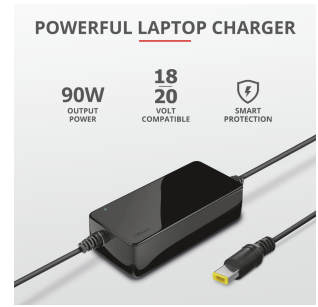
PRODUCT PICTORIAL 2