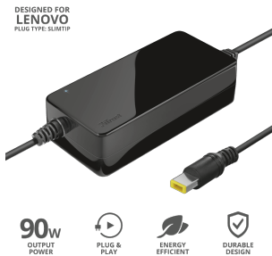
PRODUCT ESHOT 1