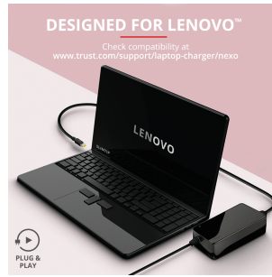
PRODUCT PICTORIAL 1