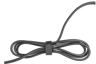
PRODUCT EXTRA 1