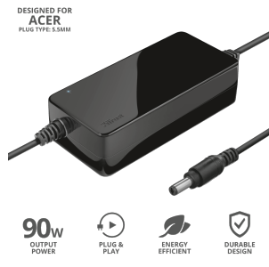
PRODUCT ESHOT 1