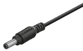
PRODUCT VISUAL 3