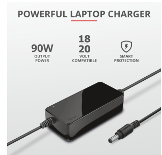
PRODUCT PICTORIAL 2