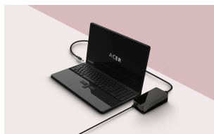
LIFESTYLE VISUAL 1