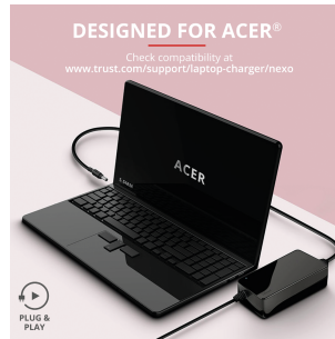
PRODUCT PICTORIAL 1