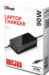
PACKAGE VISUAL 1