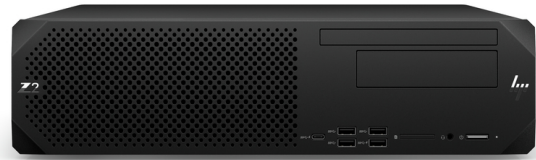
*L'image du produit peut différer du produit réel

Bénéficiez de toute la puissance d'une tour de taille normale dans un format compact. Repensée pour intégrer des cartes graphiques pleine hauteur et pleine longueur tout en laissant de la place pour des mises à niveau et des extensions, la station de travail HP Z2 à faible encombrement offre d'excellentes performances pour vos flux de travail les plus exigeants, de la conception 3D au traçage de rayons en temps réel, et répond à vos besoins d'aujourd'hui et de demain.