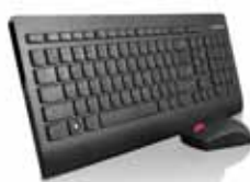
Ultraflache Wireless-Tastatur und -Maus (0A340xx)