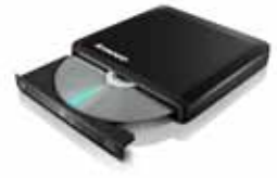
Portabler, flacher Lenovo USB-DVD-Brenner (0A33988)