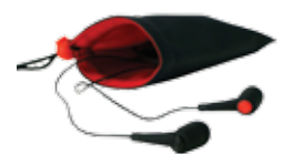
ThinkPad In-Ohr- Kopfhörer (57Y4488)