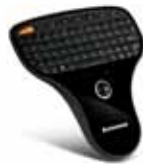
Lenovo Wireless-Tastatur (N5902)