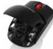
Lenovo Wireless-Maus (0A36188)