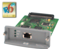
HP Jetdirect 635n