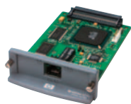
HP Jetdirect 620n