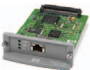
HP Jetdirect 630n