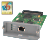
HP Jetdirect 635n