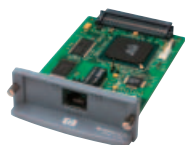
HP Jetdirect 620n