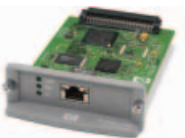
HP Jetdirect 630n