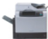
M4345 MFP (CB425A)