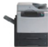
M4345x MFP (CB426A)