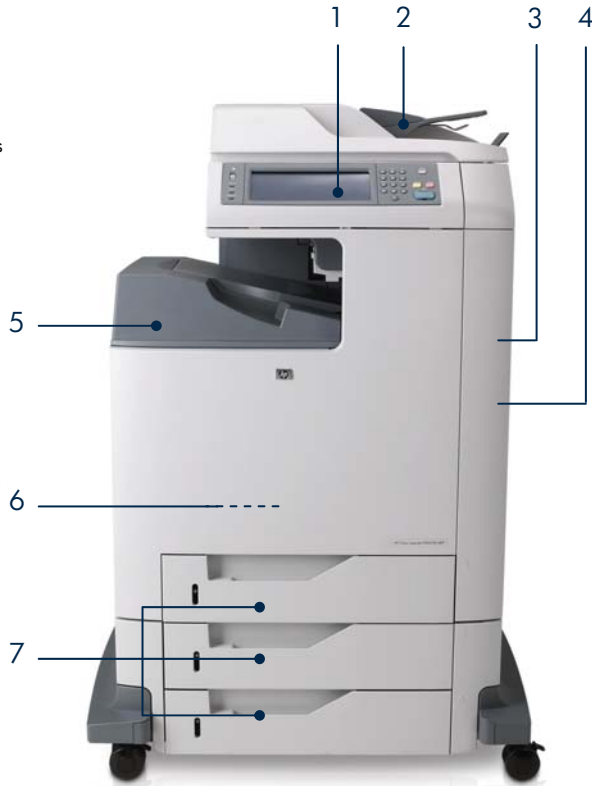
Vista frontal del HP Color LaserJet CM4730f