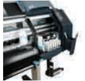
Estación de limpieza y herramientas integradas