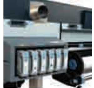
Consumibles de tinta HP de 500 ml