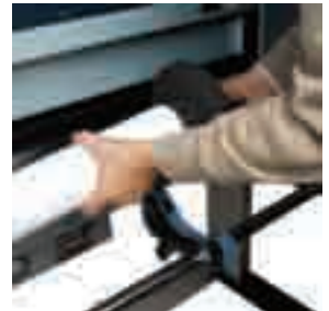
Fácil carga de medios