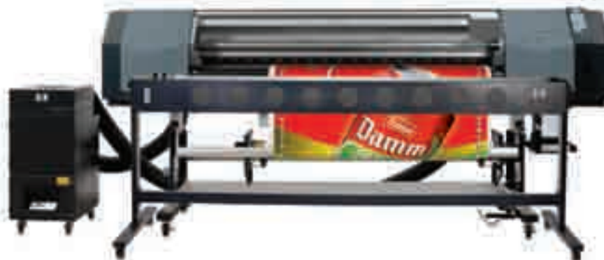
Una solución integral

Si necesita actualizarse a una solución RIP más poderosa para manejar el flujo de trabajos a color, use Onyx® PosterShop® RIP para imprimir la mejor calidad de color que su impresora puede ofrecer. Administre eficientemente sus trabajos y maneje la producción con funciones de preverificación ("preflight") y herramientas de colas de impresión.