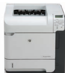
Imprimante HP LaserJet P4515n