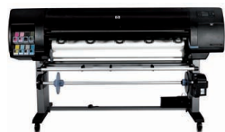
HP Designjet Z6100ps 1.524 mm Fotodrucker