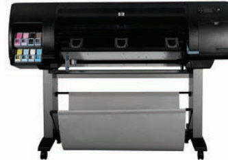
HP Designjet Z6100ps 1.067 mm Fotodrucker (Q6653A)