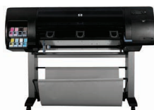
HP Designjet Z6100ps 1.067 mm Fotodrucker