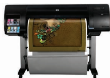
HP Designjet Z6100 1.067 mm Fotodrucker

Zuverlässiger HP Designjet Großformatdrucker für bis zu 105,4 m 2 pro Stunde, langlebige Fotos hoher Qualität mit 8 pigmentierten HP Vivera Tinten und herausragende Farbkonsistenz durch integrierten Spektrophotometer 1 .