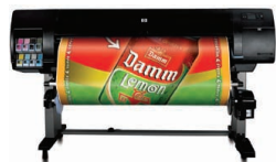
HP Designjet Z6100 1.524 mm Fotodrucker