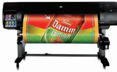
HP Designjet Z6100 1.524 mm Fotodrucker (Q6652A)