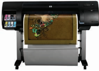
HP Designjet Z6100 1.067 mm Fotodrucker (Q6651A)