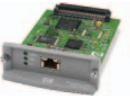
HP Jetdirect 630n