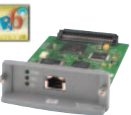
HP Jetdirect 635n