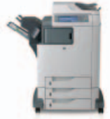
طابعة الألوان HP Color Laser Jet CM4730fsk متعددة الوظائف