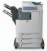
طابعة الألوان HP Color Laser Jet CM4730fm متعددة الوظائف