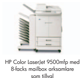
HP Color LaserJet 9500mfp med 8-facks mailbox arkamlare som tillval