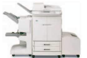
HP Color LaserJet 9500mfp, med multifunktionsfinisher och högkapacitetsmagasin som tillval