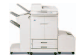
HP Color LaserJet 9500mfp, med arkamlare och häftningsfunktion samt högkapacitetsmagasin som tillval