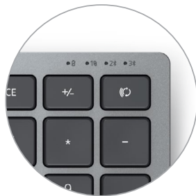
Voyants de batterie et de connectivité