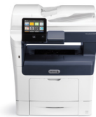
Equipo multifunción Xerox® VersaLink B405