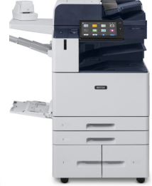
Equipo multifunción Xerox® AltaLink B8145/ B8155/ B8170

Para obtener más información sobre la tecnología Xerox® ConnectKey, vaya a www.xerox.es/es-es/connectkey .