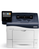
Impresora color Xerox® VersaLink® C400