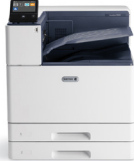
Impresora color Xerox® VersaLink C8000