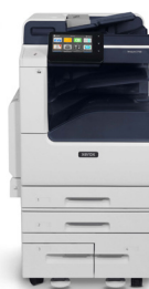
Equipo multifunción en color Xerox® VersaLink C7120/ C7125/ C7130