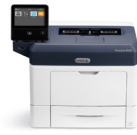
Impresora Xerox® VersaLink B400