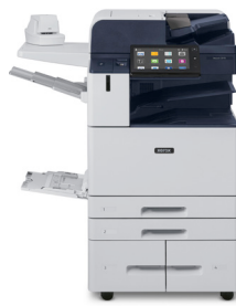
Equipo multifunción en color Xerox® AltaLink® C8130/ C8135/ C8145/ C8155/ C8170