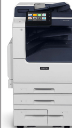
Equipo multifunción Xerox® VersaLink B7125/ B7130/ B7135