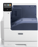
Impresora color Xerox® VersaLink C7000