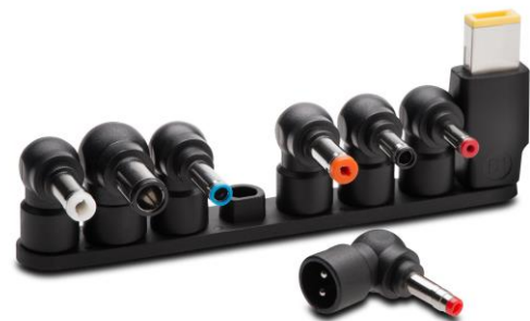
Halterung zur Befestigung von Ladeaufsätzen