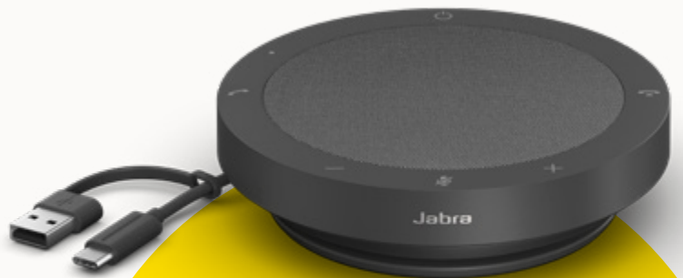
MS TEAMS- UND UC-VARIANTEN

Um unseren Planeten zu schützen, berücksichtigen wir den Aspekt der Nachhaltigkeit in jeder Phase der Produktentwicklung. Deshalb haben wir das Gehäuse der Speak2 40 aus über 50 % nachhaltigen Materialien** gefertigt und eine Reihe von Bauteilen integriert, die repariert oder ersetzt werden können. Mehr Nachhaltigkeit bedeutet eine längere Lebensdauer deiner Freisprechlösung – und sorgt für Gespräche in hoher Sprachqualität für dich und dein Team über Jahre hinweg.