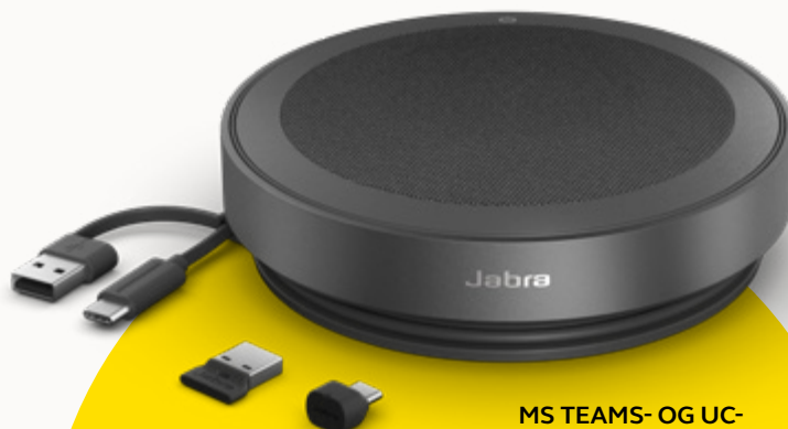
MS TEAMS- OG UC-VARIANTER

For at beskytte vores planet tager vi hensyn til bæredygtighed i alle led af produktudviklingen. Kabinettet på Speak2 75 er fremstillet med mere end 33 % bæredygtige materialer 3 , og den har en række indbyggede dele, der kan repareres eller udskiftes. Bedre bæredygtighed = længere levetid på højttaleren = flere kvalitetsopkald for dig og dit team – langt ind i fremtiden.