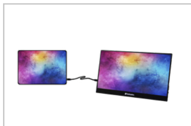
Monitor con tablet