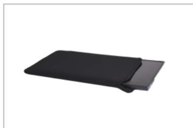
Busta protettiva in neoprene