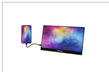
Monitor con smartphone