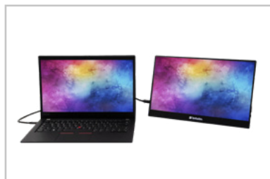
Monitor con laptop