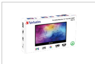
Confezione in 3D