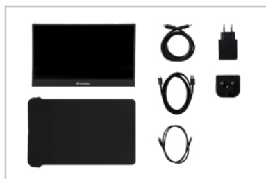
Contenuto della confezione