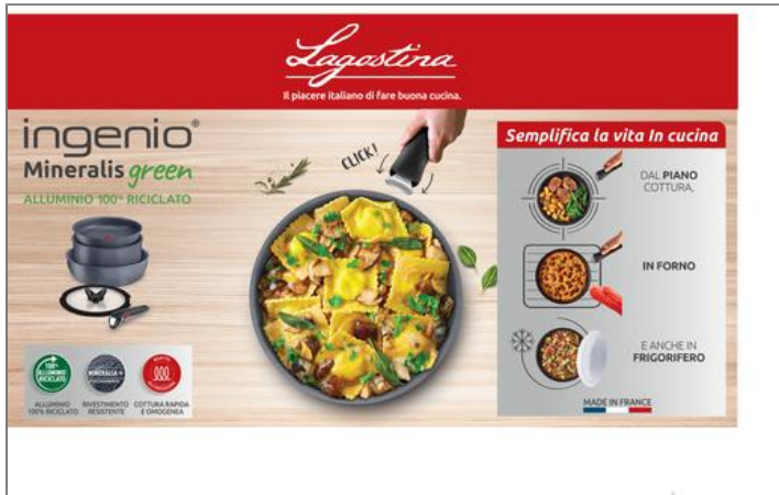
Ingenio Mineralis Green, Casseruola fonda, 16 cm 012164031016