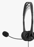
Auriculares estéreo HP de 3,5 mm G2 428H6AA