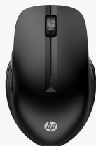
Ratón inalámbrico multidispositivo HP 430 3B4Q2AA