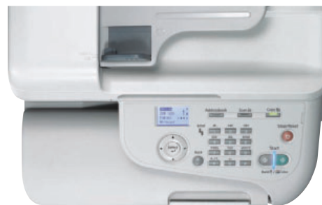
Bedienfreundlich durch die klare und zugängliche Steuerung der Epson AcuLaser CX37DN-Serie.