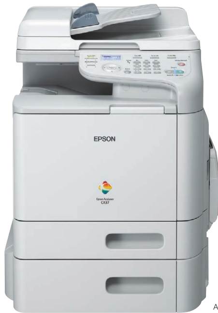
Abbildung zeigt das Modell CX37DTNF

Mit der Epson AcuLaser CX37DN-Serie können mittlere bis große Arbeitsgruppen im Format DIN A4 doppelseitig drucken und in Schwarzweiß und Farbe kopieren und scannen. Die Modelle CX37DNF und CX37DTNF verfügen zusätzlich über eine Faxfunktion. Die Serie bietet in der Standardausstattung außerdem einen automatischen Dokumenteneinzug. Mit der optionalen zusätzlichen Papierkassette können Sie ganz einfach die Papierkapazität erhöhen – für eine noch bessere Produktivität. Diese ist bei den Modellen CX17DTN und CX37DTNF standardmäßig im Lieferumfang enthalten.