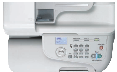
Bedienfreundlich durch die klare und zugängliche Steuerung der Epson AcuLaser CX37DN-Serie.