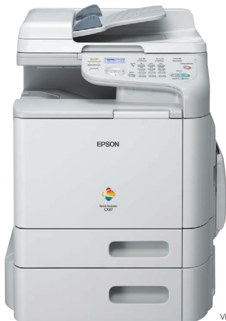
Vist modell er CX37DTNF

Epson AcuLaser CX37DN-serien gjør det mulig for middels til store arbeidsgrupper å skrive ut tosidig i A4, pluss kopiere og skanne i farger og svart-hvitt, med faks tilgjengelig på modellene CX37DNF og CX37DTNF. Serien kommer også med en automatisk dokumentmater som standard, samtidig som en ekstra papirskuff er tilgjengelig for å spare arbeidsgrupper tid ved at man raskt og enkelt øker papirkapasiteten.