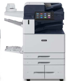
Xerox® AltaLink® B8145/B8155/ B8170 Multifunktions- Drucker

*Produkt nicht in allen Regionen verfügbar, bitte wenden Sie sich an Ihren Verkaufsrepräsentanten.