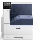
Xerox® VersaLink® C7000 Farbdrucker