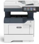
Xerox® VersaLink® B415 Multifunktions Drucker