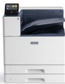
Xerox® VersaLink® C8000 Farbdrucker