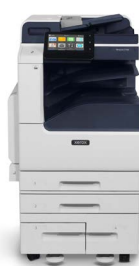
Xerox® VersaLink® C7120/C7125/ C7130 Multifunktions- Farbdrucker