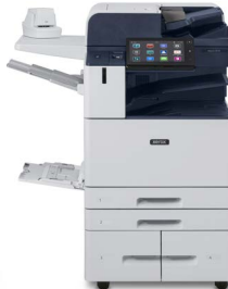
Xerox® AltaLink® C8130/C8135/ C8145/C8155/ C8170 Multifunktions- Farbdrucker