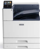
Xerox® VersaLink® C9000 Farbdrucker