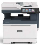
Xerox® VersaLink® C415 Multifunktions-Farbdrucker