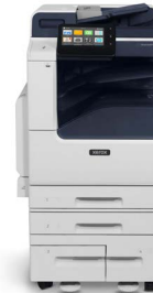
Xerox® VersaLink® B7125/B7130/ B7135 Multifunktions- Drucker