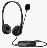
Auriculares estéreo USB HP G2 428H5AA