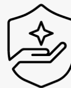
3 lata z odbiorem i zwrotem UM917E