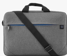
Borsa per notebook HP Prelude da 15,6" 2Z8P4AA